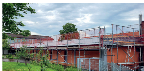
Sanierung Dach Werkstattgebäude Schule, 160.000 Euro