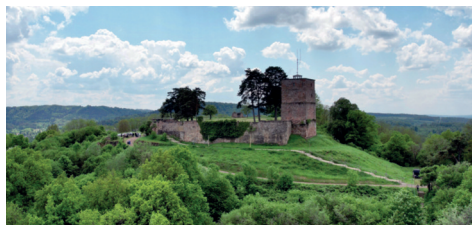
Tourismusförderung – Einrichtung eines Burgbistros und Belegung der Burg mit Veranstaltungen