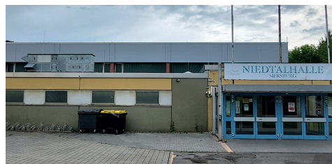
Sanierung der Vor- und Nebenräumdächer der Niedtalhalle, 230.000 Euro