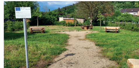
Abriss und Freiflächengestaltung Haus Ulbricht, Itzbach, rund 380.000 Euro mit entsprechenden Zuschüssen