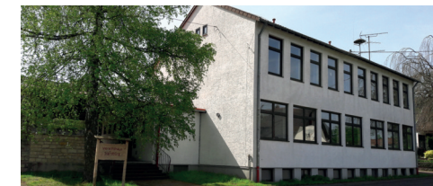
Nach Errichtung einer neuen Flüchtlingsunterkunft in der Gemeinde: Freigabe des Vereinshauses für die Siersburger Vereine und die Bürgerinnen und Bürger im Sinne der vorherigen Nutzung. Notwendige Sanierungsmaßnahmen: Fenster, Lüftungsanlage und Heizung