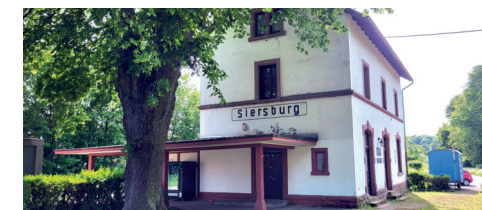
Sanierung Erdgeschoss Bahnhof mit dem Ziel der Wiedereröffnung des Jugendtreffs