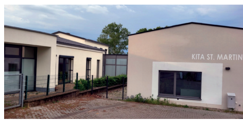
Erweiterung Kindergarten St. Martin um 3 Gruppen, rund 2,7 Millionen Euro