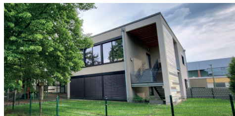
Erweiterung Kindergarten St. Willibrord: Investitionskosten ca. 2 Millionen Euro