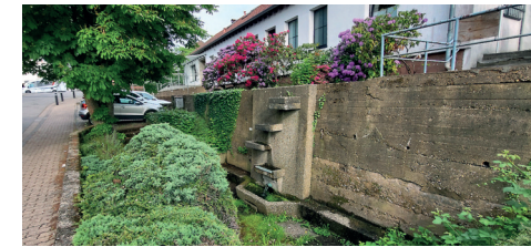
Neugestaltung Bereich um den Brunnen vor dem Parkplatz der Niedtalhalle ggf. mit einer Bürgerwerkstatt