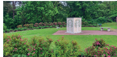
Anlegung eines Natururnengrabfeldes auf dem Friedhof Itzbach