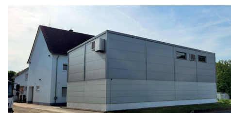
Neubau Wasserwerk, rund 2 Millionen Euro