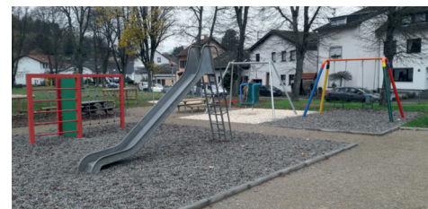
Anlegung eines inklusiven Kinderspielfeldes auf der Dorfweiese Itzbach, rund 133.000 Euro mit entspr. Zuschüssen