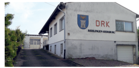
Sanierung des gemeindeeigenen DRK-Gebäudes, rund 75.000 Euro