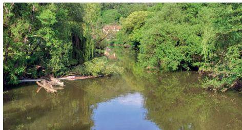
Nied als Badegewässer