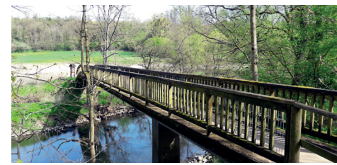
Sanierung der Brücke über die Nied an der Birkenbach und behindertengerechte Rampe, rund 60.000 Euro