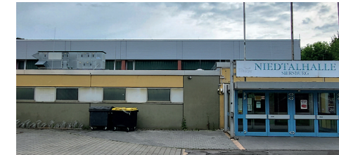
Duschräume Niedtalhalle Fensteranierung Niedtalhalle Sanierung der Duschräume in der Schulturnhalle im unteren Teil

Folgende Punkte sind uns für die folgenden fünf Jahre wichtig: