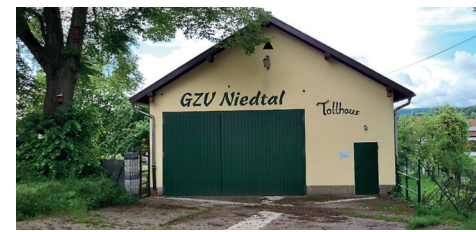
Sanierung Tollhaus: Dach und Innenbereich, rund 100.000 Euro