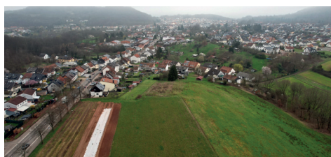
Neubaugelbiet „Ölgrund“ : Fläche: rd. 2 ha, ca. 25 Wohneinheiten. Kommunaler Wohnungsbau im Eicherts-wald an der Stelle der bisherigen Altbauten