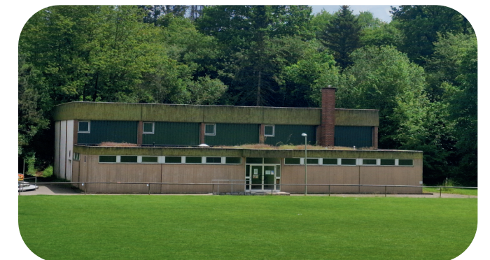
Turnhalle Michelbach

Viele Schmelzer Vereine nutzen auch die Turnhalle Michelbach, die seit Herbst 2023 nach langen Sanierungsarbeiten endlich wieder genutzt werden kann. Für die abschließende Sanierung der Dachfläche sind im laufenden Haushalt der Gemeinde Schmelz nochmals 350.000 € veranschlagt. Auf Anregung der Michelbacher SPD-Ortsratsfraktion soll die Turnhalle in Zukunft auch als Mehrzweckhalle für Veranstaltungen genutzt werden können und somit die sportliche Nutzung ergänzen.