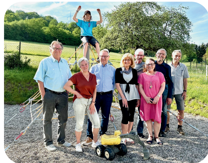
Mitglieder des SPD-Ortsvereins Dorf auf dem neuen Spielplatz in der Mühlenbergstraße