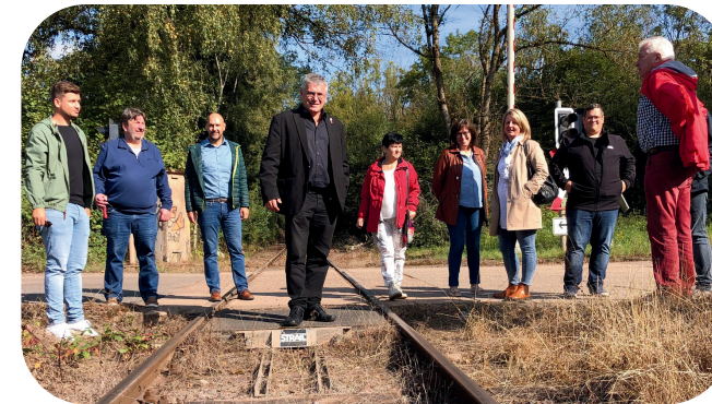
Besichtigung der Bahnstrecke mit dem Bundesabgeordneten Christian Party (Mitte)

Der SPD-Gemeindevorband ist mit der SPD geführten Landesregierung auf einer Linie, wenn es um die mögliche Reaktivierung der Primstalbahn geht.