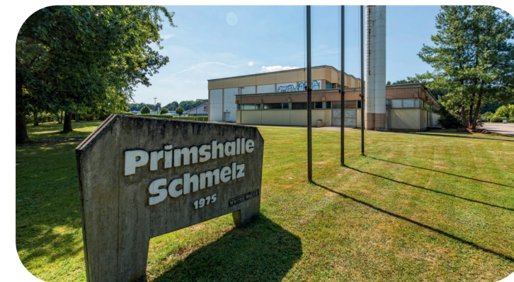
Primshalle Schmelz

Noch in diesem Jahr wird die Erneuerung des Hallenbodens und der Zuschauertribüne in der Primshalle umgesetzt und den Schmelzer Vereinen wieder zur Verfügung stehen. Insgesamt wird die Gemeinde Schmelz in diese Maßnahmen 700.000 € investieren. Wir als SPD-Gemeinderatsfraktion unterstützen dies gerne und freuen uns schon jetzt auf viele tolle Sportevents und Veranstaltungen auf dem neuem Hallenboden und mit den neuen Tribünen.